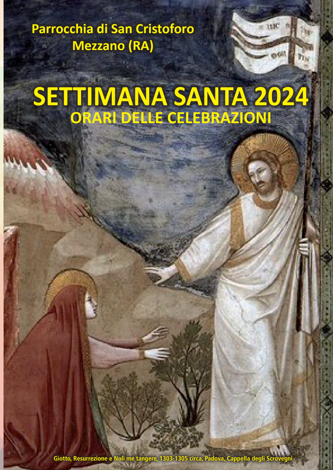
Giotto, Resurrezione e Noli me tangere, 1303-1305 circa, Padova, Cappella degli Scrovegni